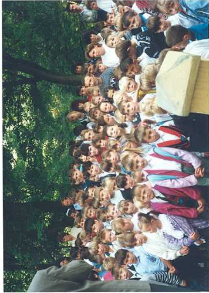
Licznie zgromadzeni Rodzice i dzieci rozpoczęcie roku 1996/97